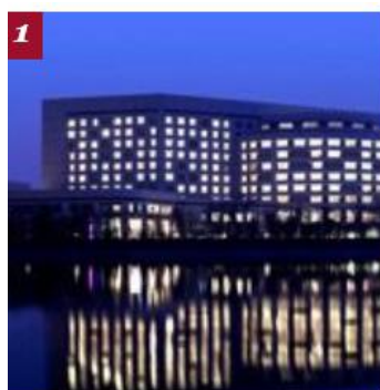
天津万豪行政公寓

http://www.marriott.com.cn/hotel-search/tianjin.hotels.china.travel/hotels.marriott-executive-apartments/