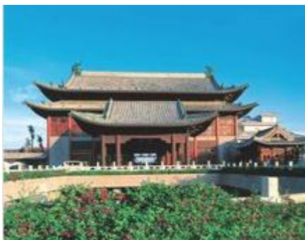
亚龙湾华宇皇冠假日酒店